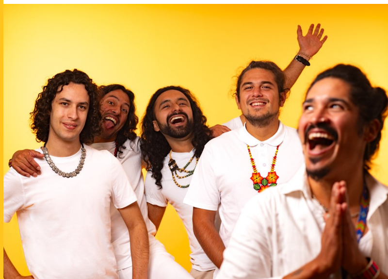
Konzert mit El Flecha Negra am 08.11.2025 – lateinamerikanische Rhythmen und karibische Leichtigkeit